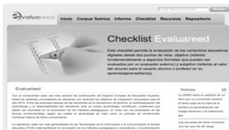
Ilustración 1. Página de acceso al portal Evaluareed

El resultado final del proyecto ha sido un portal web centrado en la evaluación de recursos electrónicos educativos desde el que se tiene acceso al checklist Evaluareed, núcleo del portal, y a una serie de secciones auxiliares que lo complementan y que sirven para profundizar en el tema (corpus teórico, informe detallado del proyecto, recursos evaluados y bibliografía), diseñado de forma que permite un acceso sencillo e intuitivo a los contenidos, especialmente al uso del checklist y de los informes de evaluación. Desde su lanzamiento piloto en 2011 el portal ha sido actualizado con regularidad, siendo la última versión de principios de 2015 ( http://www.evaluareed.edu.es ).